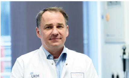
Prof. Dr. med. Dirk Föll

Die Versorgung von Kindern und Jugendlichen mit rheumatischen oder immunologischen Erkrankungen findet heute hauptsächlich ambulant statt, daher sind wir überwiegend im Bereich der Sprechstunden tätig. Allerdings machen schwere Verläufe oder Komplikationen nicht selten eine stationäre Behandlung notwendig. Deshalb ist es von großer Bedeutung, am UKM die Möglichkeit zur Versorgung auch schwerstkranker Patient*innen mit Kinderrheuma oder Immundefekten anbieten zu können. Im Falle eines stationären Behandlungsbedarfes werden unsere Patient*innen auf den Stationen des Zentrums für Kinderheilkunde und Jugendmedizin kompetent betreut.