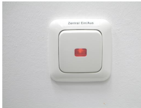
Allgemeine Notabsperkung für Strom an allen Labortischen und am Tableau im Büro des Laborleiters (Raum 05.401) sowie am VK-Phantom-Demo-Platz