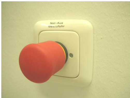
Notabsperkung für Gas vor Raum 05.402 und Raum 05.403